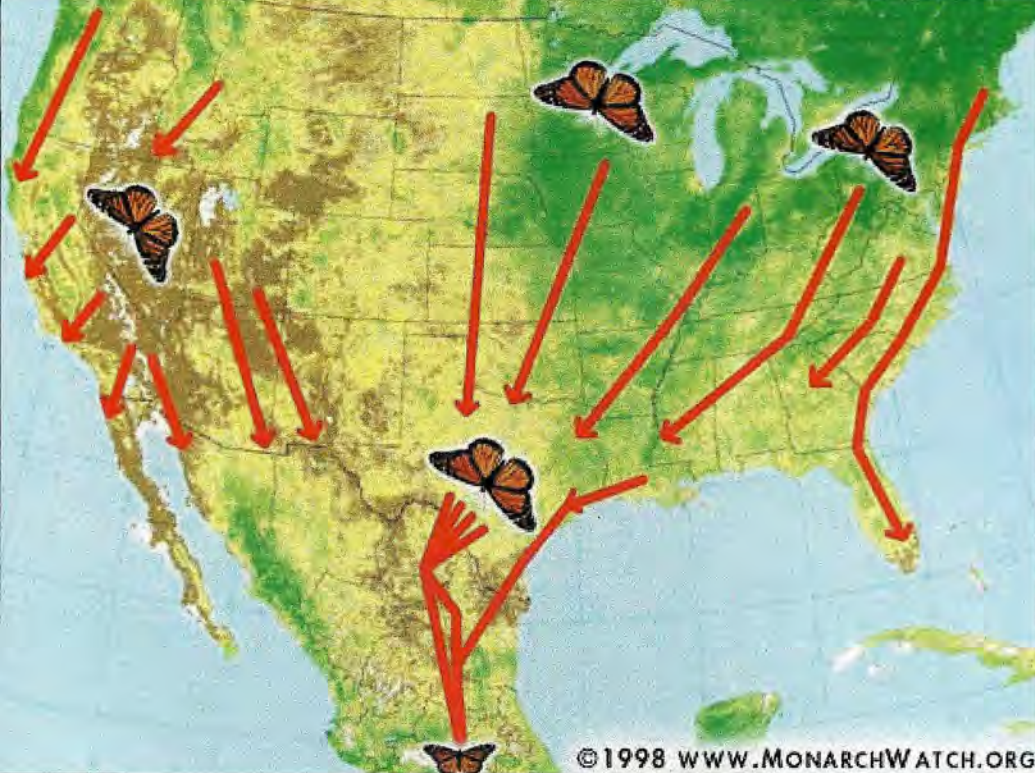
Lors de leur migration automnale, les Monarques suivent des routes convergeant toutes vers le Mexique.