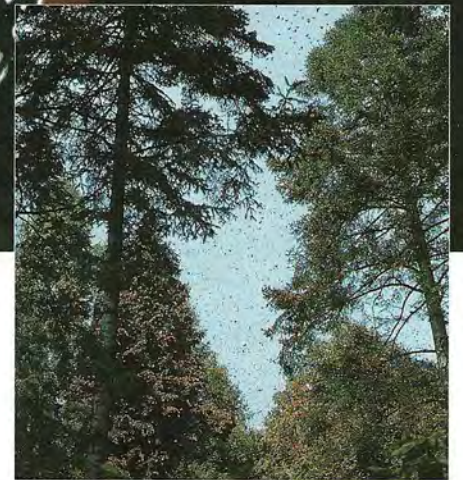
Arrivés au terme de leur longue migration automnale, les Monarques retrouvent les sites d'hivernation (ici le sanctuaire El Rosario) où ils se regroupent par millions.

reux des milieux tempérés, ce papillon retourne, chaque automne, dans une région où le climat est plus propice à sa survie et où les températures descendent rarement en dessous de 0° C. Cette migration, l'une des plus spectaculaires du monde animal, captive l'imagination de l'homme, car pesant à peine un demi-gramme, ce papillon parcourt, l'automne venu, jusqu'à 4 000 km pour passer l'hiver dans les montagnes centrales du Mexique. Ces sites, où certaines années s'entassent jusqu'à 25 millions d'individus, offrent au Monarque des conditions microcli-