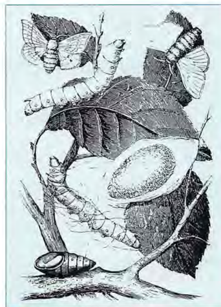
Ver à soie à ses divers stades (chenille, chrysalide et papillon) - L. Figuiet - 1867

En juillet 1869, en fin de campagne, il analyse ainsi ses travaux : "Il y a cinq ans je commençais mes études sur la maladie des vers à soie. Les savants et les praticiens assignaient alors pour cause au fléau une maladie unique, nouvelle selon les uns, déjà ancienne selon d'autres. On la désignait en France du nom de pébrine, en Italie des noms de gatine ou d'atrophie. Dès 1867 je m'étais rendu maître de cette affection, non par la découverte d'un remède que je n'ai pas cherché, mais par un moyen préventif