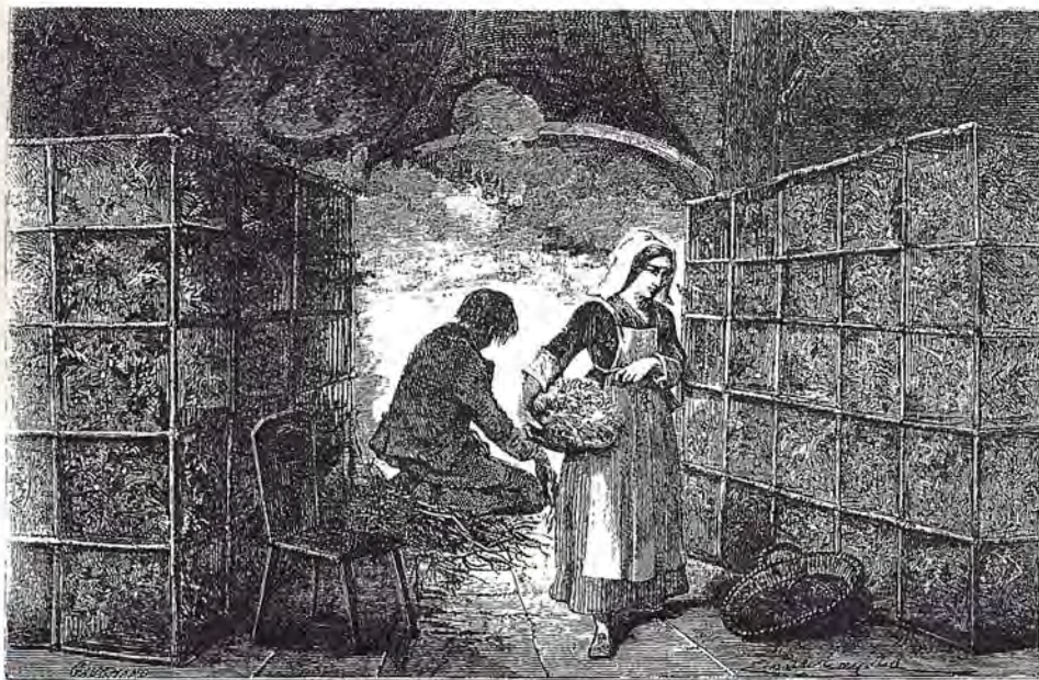
■ Une éducation du Ver à soie chez un paysan des Cévennes - L. Figuiet - 1867.