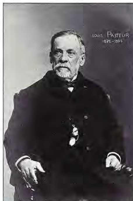
■ Louis Pasteur (1822 - 1895)