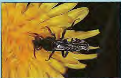
■ Abeille-coucou du genre Nomada , parasite des Andrènes. Les Abeilles de ce genre, peu poilues et souvent bien colorées, peuvent être confondues avec des Guêpes solitaires.

Dans les nids, les principaux facteurs externes de mortalité sont le parasitisme par les Abeilles-coucous ou par d'autres insectes, le développement de moisissures et la prédation.