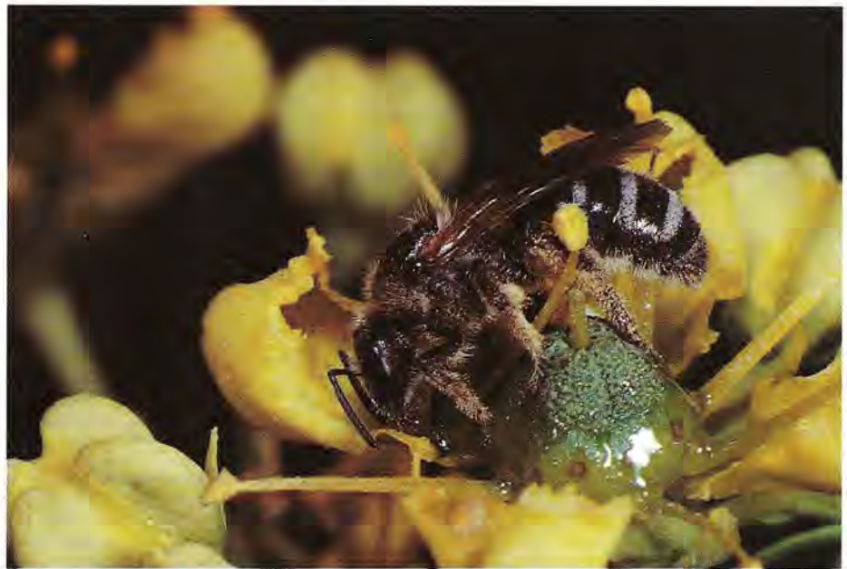
Femelle de l'Halicte Lasioglossum zonulum occupée à prélever du nectar sur une fleur de Ruta graveolens (Rue des jardins). (Cliché M. Paquay).

Parmi elles, les femelles sont reconnaissables