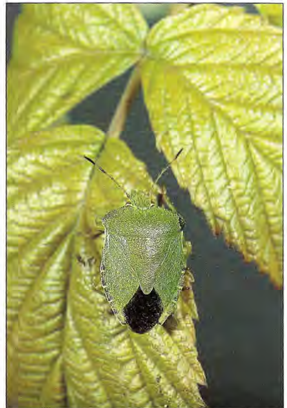
Palomena prasina

Notons que la mauvaise odeur de ces sécrétions n'est pas la règle, plusieurs en effet ne sont pas perceptibles par l'odorat humain, et les glandes odoriférantes de certaines espèces servent, en Asie du Sud-Est, de condiment !