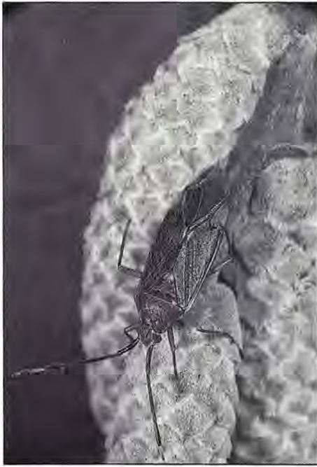
Pantillus tunicatus sur chaton de noisetier