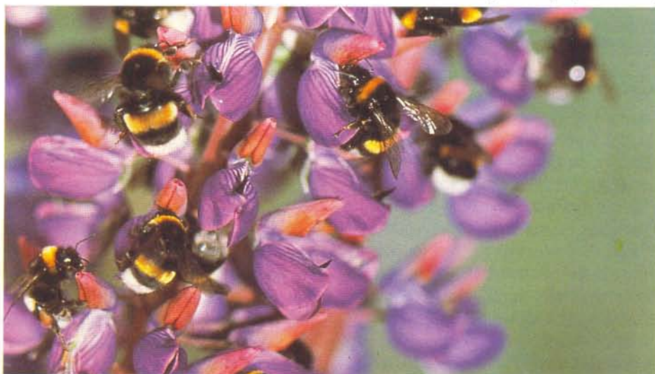
Ouvrières de Bombus terrestris butinant des fleurs de lupin