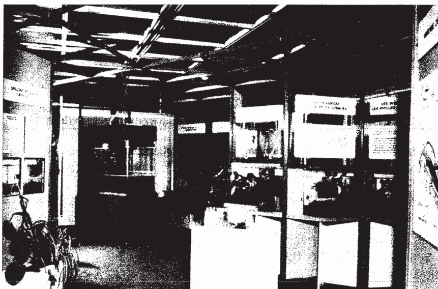
Dans sa salle d'exposition permanente, l'O.P.I.E. reçoit plus de 6000 visites par an.

Les expositions permanentes permettent de présenter des "objets lourds" maquettes, audiovisuels, élevages d'insectes qui complètent et concrétisent l'information transmise sur des panneaux et favorisent un contact physique avec le sujet présenté. Les expositions itinérantes n'ont pas cet avantage. Aussi il est utile de prévoir des animateurs qui donneront une orientation active à cette manifestation. Dans tous les cas lors de la conception et durant la réalisation d'une exposition, nous nous assurons la caution scientifique de spécialistes.